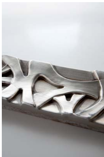
Detalle acabado plata

En el caso que les pidieran espejos con más de 1 mts 2 , a parte del importe del mismo tendrían que añadirle 10€ más por recargo de embalaje; ya que todo lo que supere de esa medida tiene que ir mucho más protegido de posibles roturas.