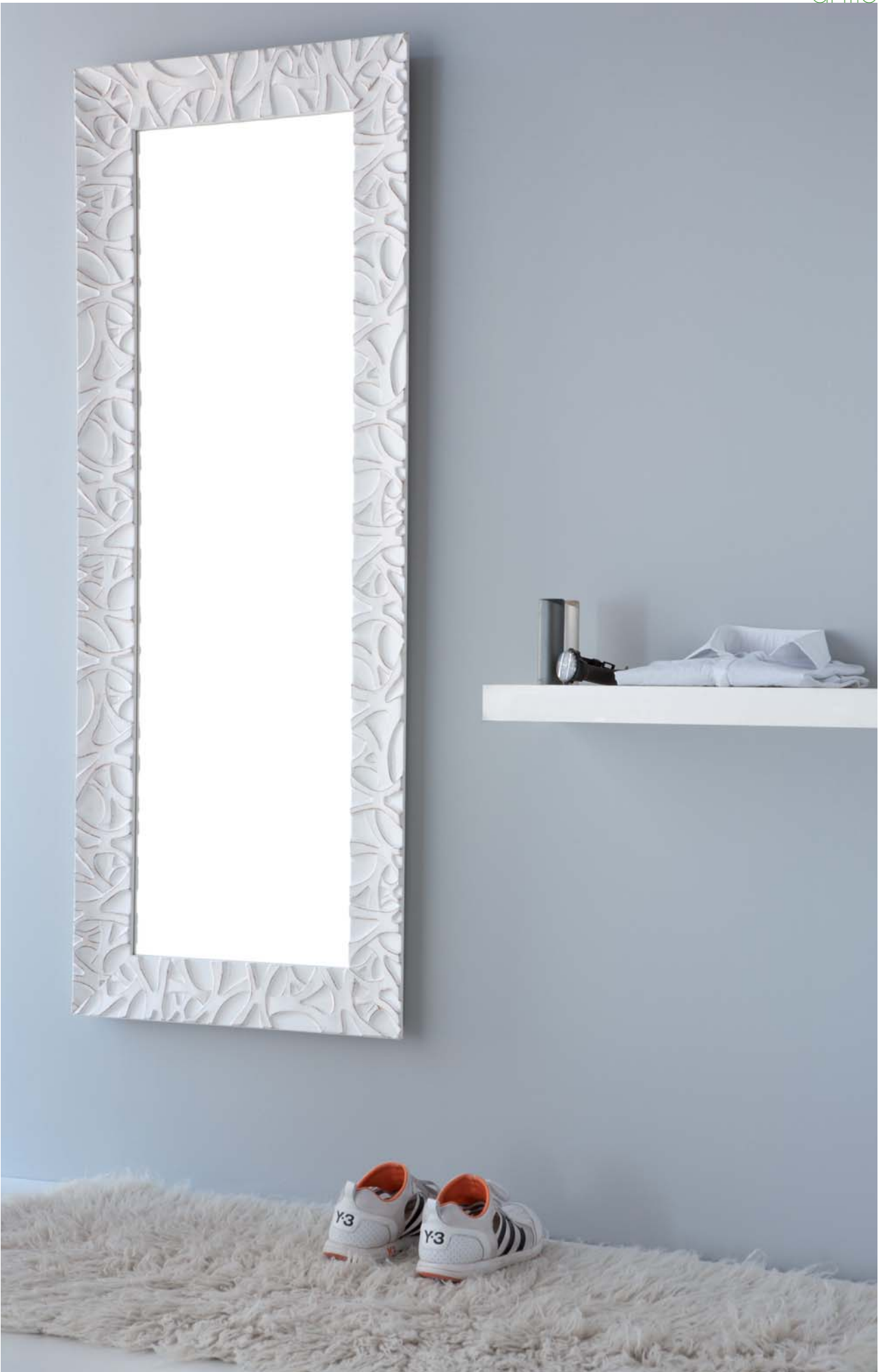
149 x 59 cm. Acabado blanco