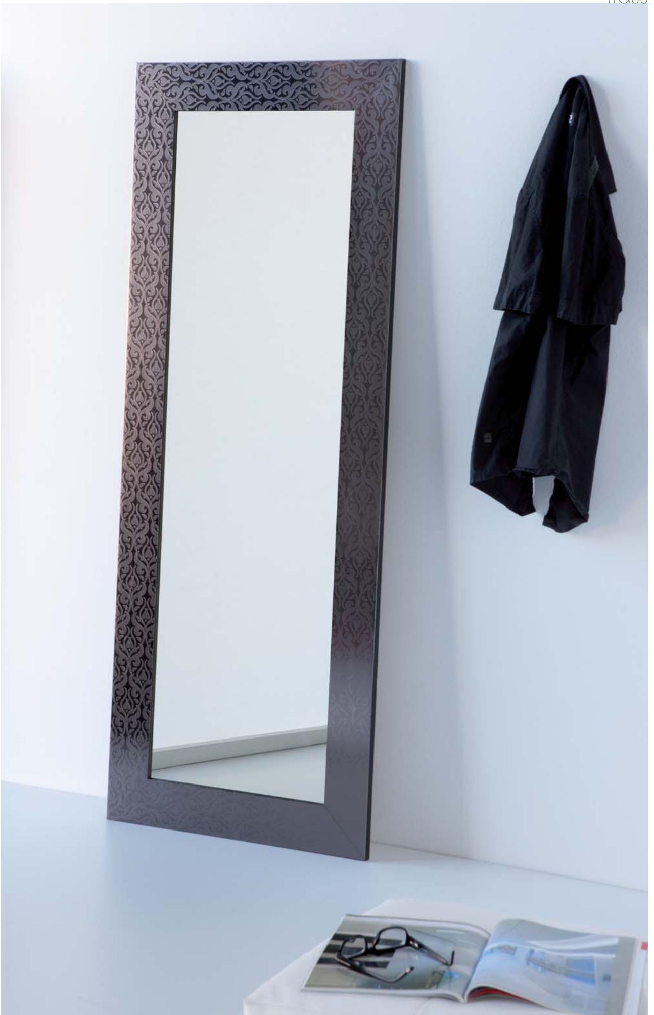
147 x 57 cm.