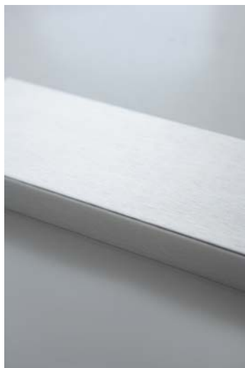
Detalle acabado marco

En el caso que les pidieran espejos con más de 1 mts 2 , a parte del importe del mismo tendrían que añadirle 10€ más por recargo de embalaje; ya que todo lo que supere de esa medida tiene que ir mucho más protegido de posibles roturas.