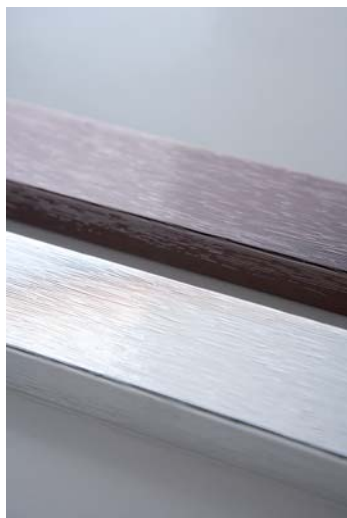
Detalle acabado negro

En el caso que les pidieran espejos con más de 1 mts 2 , a parte del importe del mismo tendrían que añadirle 10€ más por recargo de embalaje; ya que todo lo que supere de esa medida tiene que ir mucho más protegido de posibles roturas.