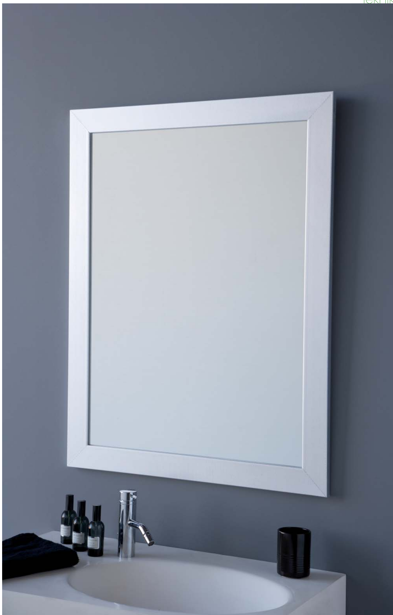
81 x 61 cm.