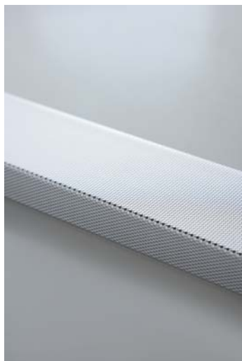
Detalle acabado plata

En el caso que les pidieran espejos con más de 1 mts 2 , a parte del importe del mismo tendrían que añadirle 10€ más por recargo de embalaje; ya que todo lo que supere de esa medida tiene que ir mucho más protegido de posibles roturas.