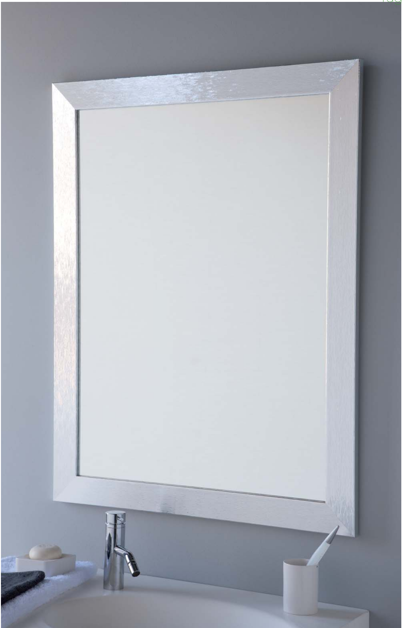
81 x 61 cm.